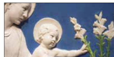
Della Robbia Exhibit 3