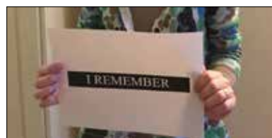
Giorno della Memoria 2