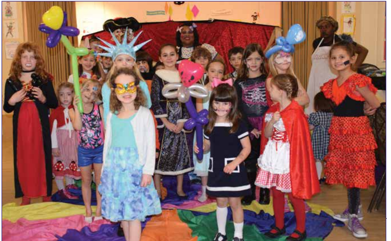
Children happily celebrating Carnevale at the Casa Italiana Sociocultural Center. See more on page 4.