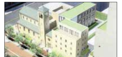
Casa Italiana Capital Fund 7